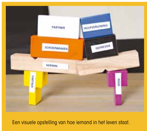
Een visuele opstelling van hoe iemand in het leven staat.

Om zichzelf weer te geven koos ze de balk met een breuk erin. Daarna ging ze met mij in gesprek over de blokken waar zij last van had. Het grootste blok was voor haar dat ze te veel bezig was met de schoonmaak. Daarover bleek ze in een veilig contact heel goed te kunnen praten. Later koos zij er een ander blok bij dat stond voor haar heimwee naar haar land. Zij vertelde geëmotioneerd dat zij niet gelukkig is en dat al dat schoonmaken daar eigenlijk van komt. Zij vertelde dat zij in Turkije nooit last heeft van dwangmatig schoonmaken. Ook de zorg voor haar kinderen was voor haar een belastende factor.