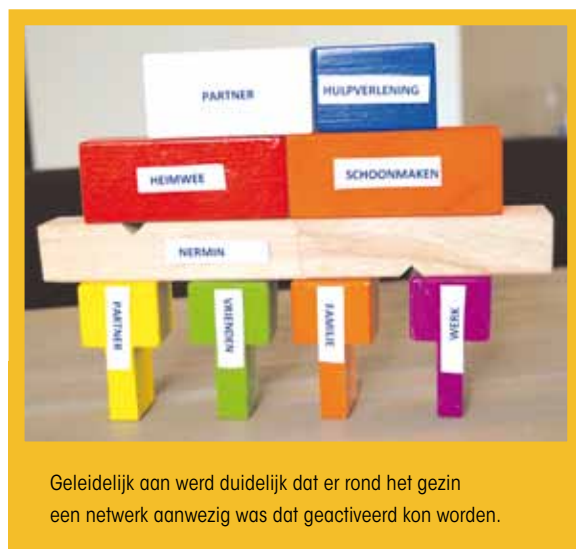
Geleidelijk aan werd duidelijk dat er rond het gezin een netwerk aanwezig was dat geactiveerd kon worden.